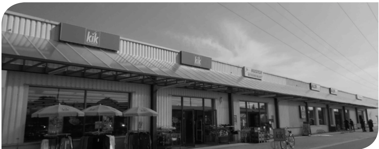
Ansicht auf die Ladenzeile mit den Mietern Kik, Getränke-Huster, ALDI und Thomas Philipps