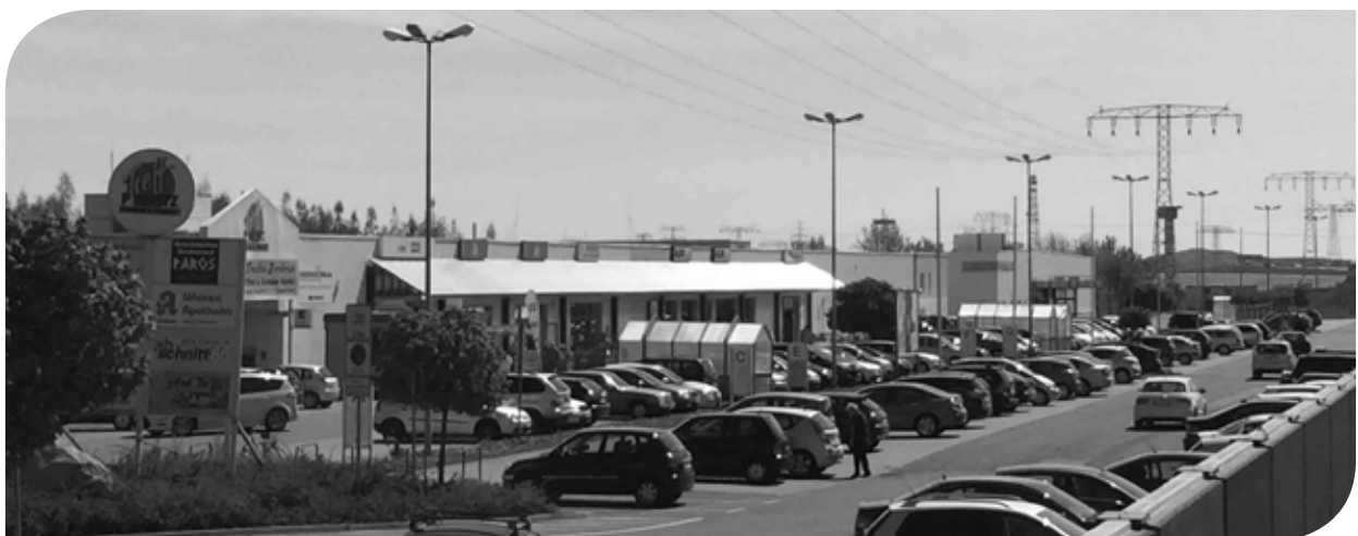
Blick auf das Fachmarktzentrum Portitz-Treff