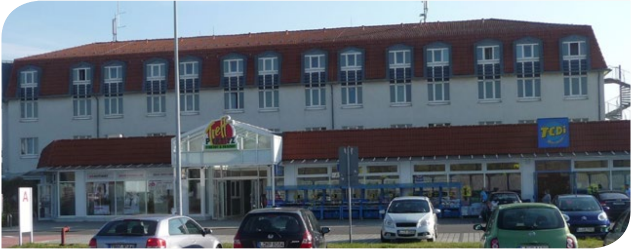
Blick auf das Stadtteilzentrum Portitz-Treff in Leipzig