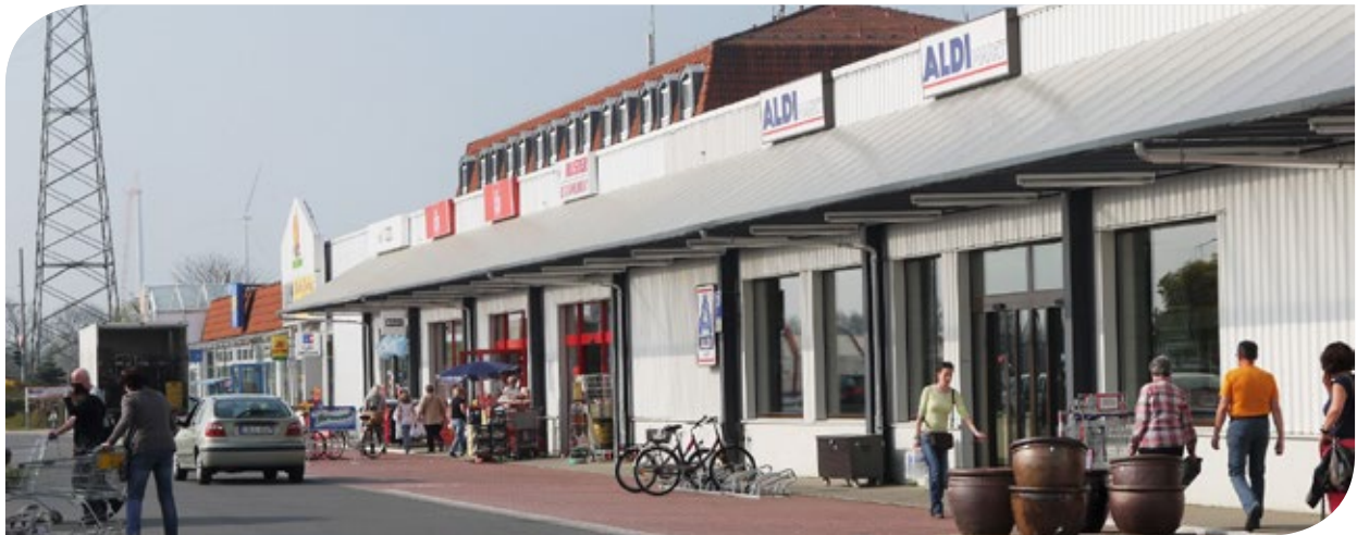
Blick auf die Ladenzeile mit Mall-Eingang im Hintergrund