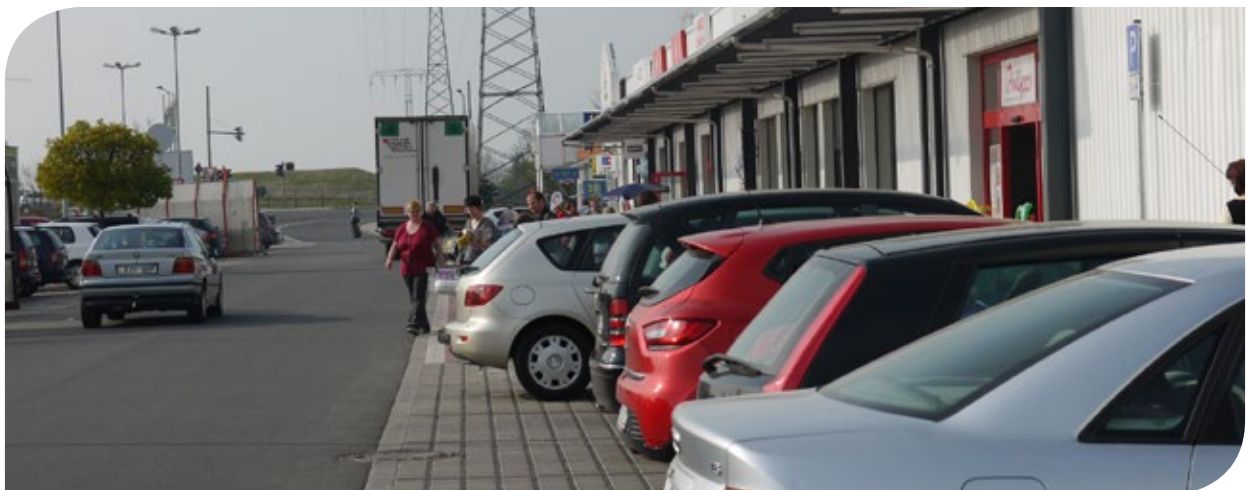
Blick auf die Ladenzeile