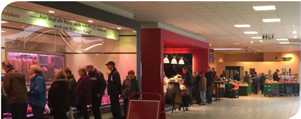
Ansicht in die Mall mit Metzgerei Reißhaus, Bäckerei Erntebrot und Früchte Armbrust