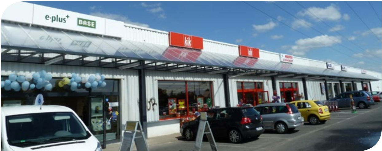
Ladenzeile mit Mieter DuBcom, Kik, Getränke Huster ALDI und Thomas Philipps