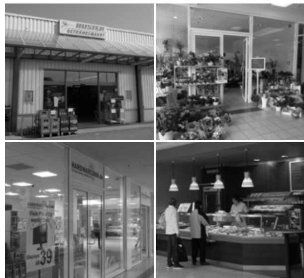
Getränke Huster, Blumenhaus Franke, Hardware 3000 und Bäckerei Erntebrot