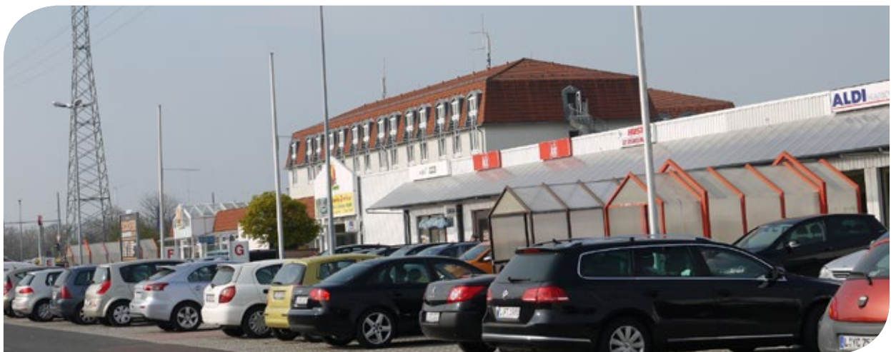
Ansicht auf die Fondsimmobilie Stadtteilzentrum Portitz-Treff