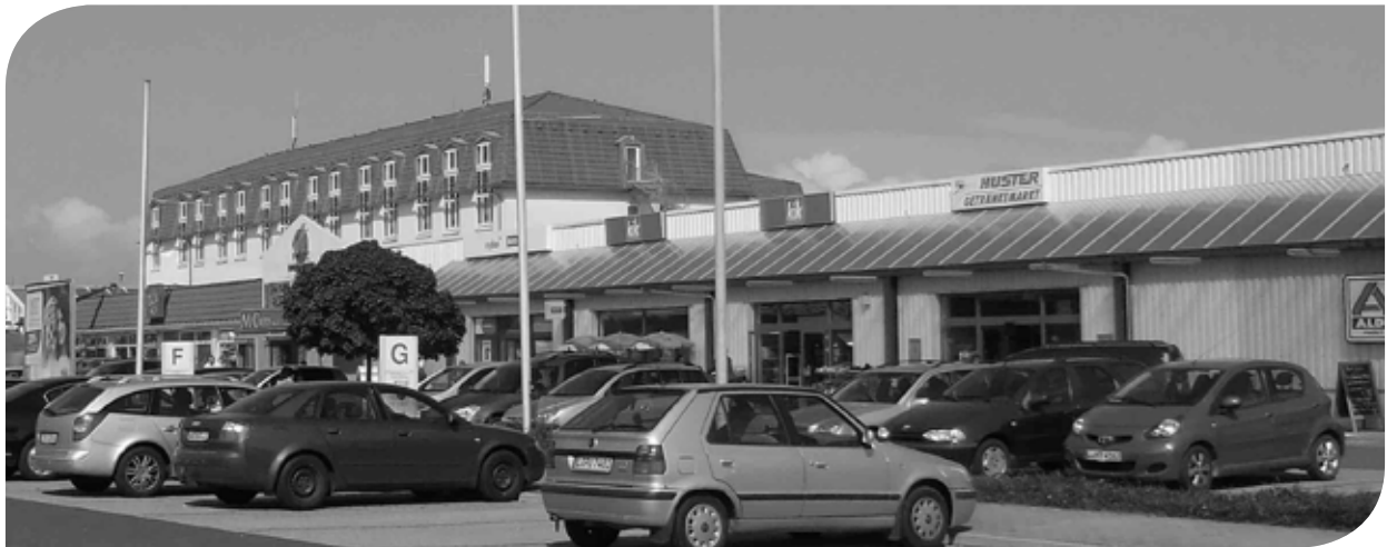
Blick auf die Fondsimmoblie