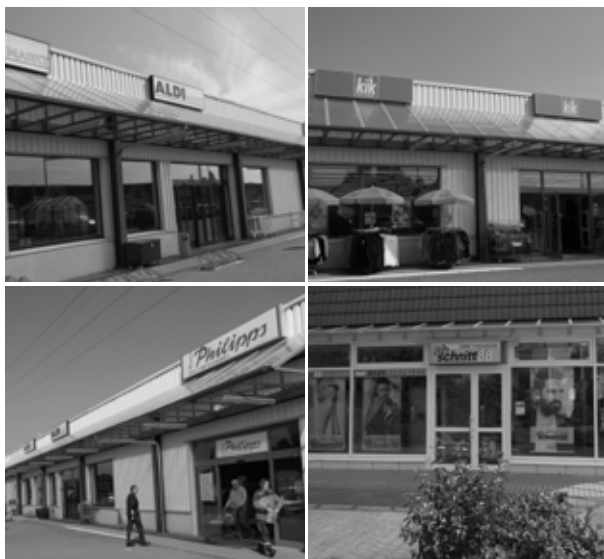
Portitz-Treff mit Mieterauswahl ALDI, Kik, Thomas Philipps, Friseur Abschnitt 88

Zur Generierung zusätzlicher Einnahmen wurde auf dem Parkplatz der Eigentümergemeinschaft ein Standplatz an einen Imbisswagenbetreiber vermietet. Der Betreiber zeigt sich mit dem Standort sehr zufrieden. Die Mieteinnahmen fließen der Eigentümergemeinschaft zu und reduzieren die von der