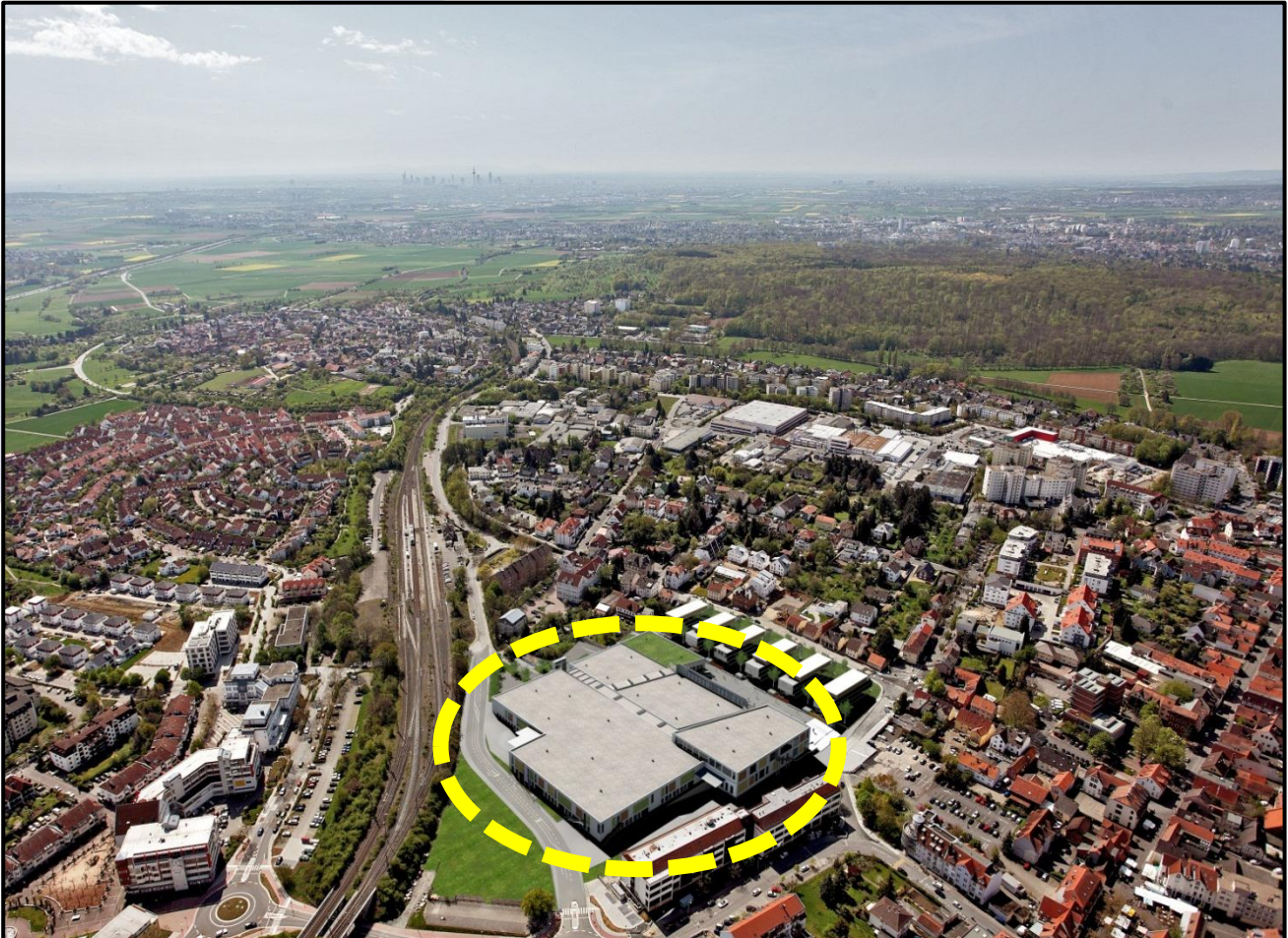
Fondsobjekt ILG Fonds Nr. 38: Taunus Carré in Friedrichsdorf – Visualisierung – Im Hintergrund Frankfurt a.M.

Plangemäß konnte der Prospekt zum kommenden ILG Fonds Nr. 38 vor einigen Tagen bei der Bafin zur Prüfung eingereicht werden. Damit sollte der Fonds, da vor dem 01. Juni bei der