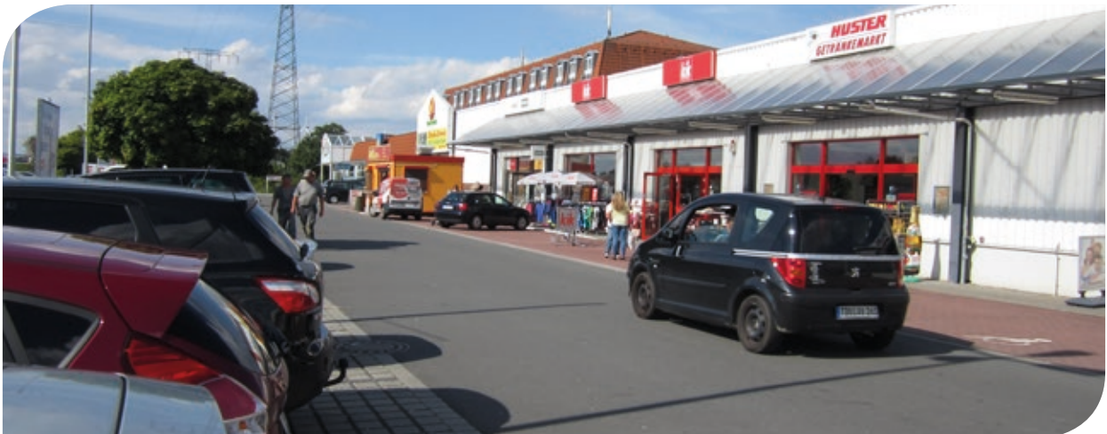
Parkplatz mit Ladenzeile