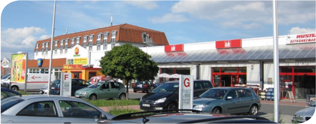
Fondsimmobilie Stadtteilzentrum Portitz-Treff in Leipzig