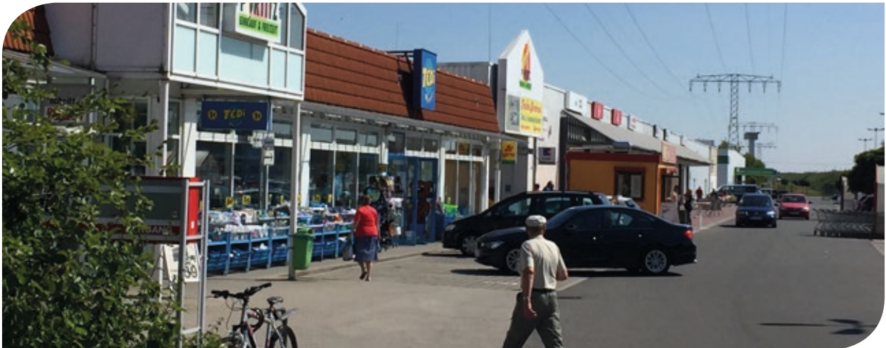
Ladenzeile mit Haupteingang in die Mall