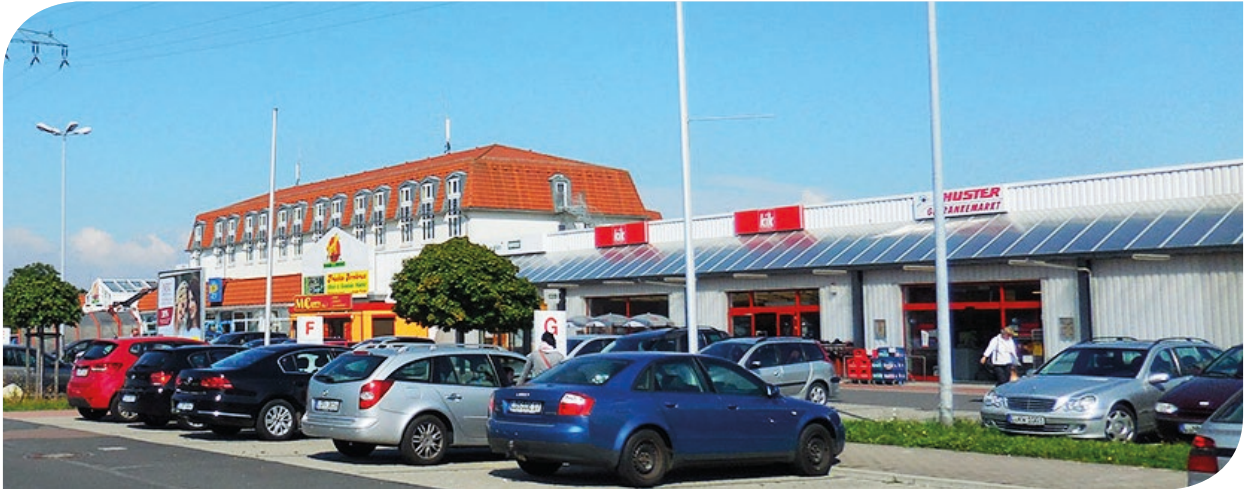
Fondsimmobilie Stadtteilzentrum Portitz-Treff in Leipzig