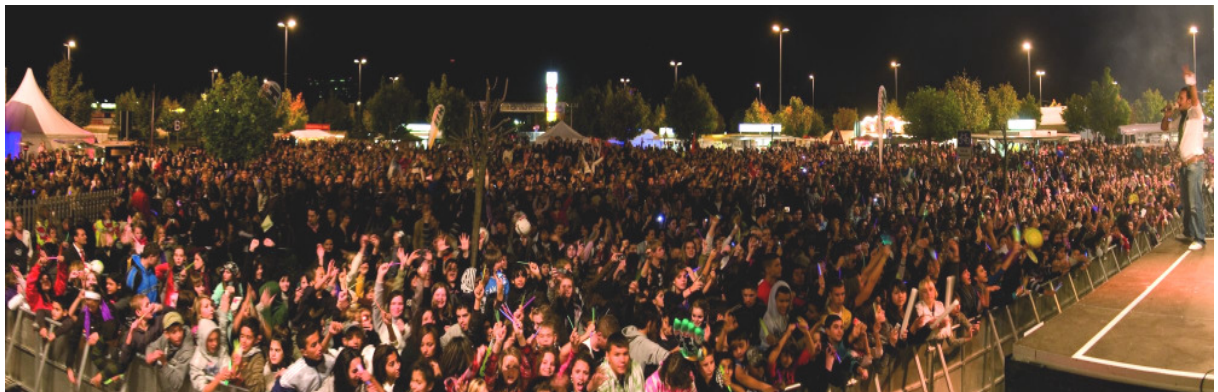
Diese Fotos geben Eindrücke vom Public Viewing während der Fußball-WM 2010 wieder.