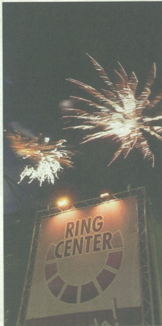
Das Offenbacher Ringcenter war am Samstag Ziel ungezählter Partygäste. Das Einkaufszentrum wurde vor zehn Jahren eröffnet, feierte nun mit einem Großaufgebot an Unterhaltungsprofis vom Luftballonknoter bis zum Feuerwerker. Größter Pegelausschlag am Abend: die Teenietruppe „Queensberry“.

Tausende pilgerten zur großen Geburtstagsparty des zehnjährigen Ringcenters und demonstrierten ihre Einheit mit dem Konsumtempel.