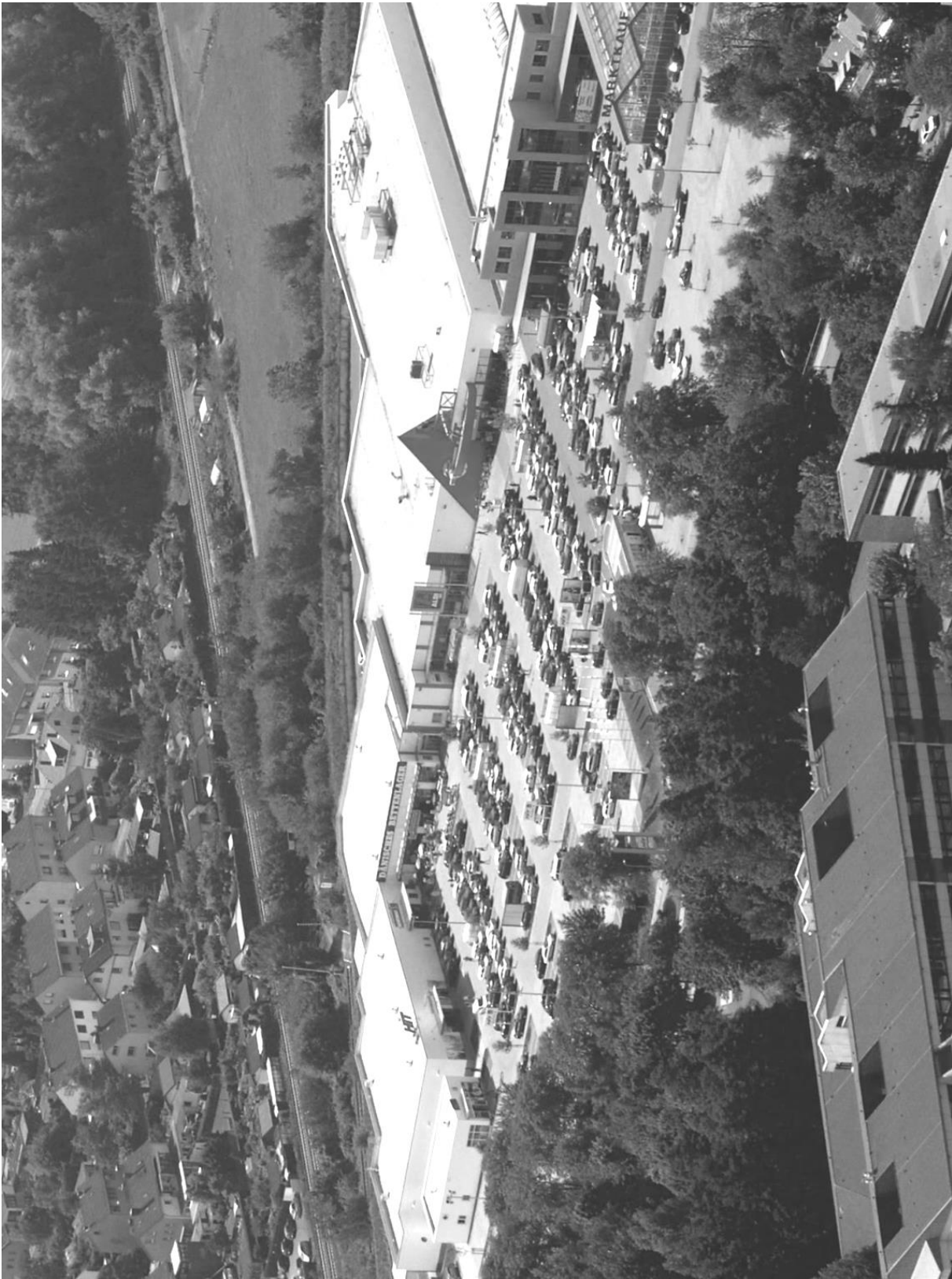
Der rechts zu sehende Marktkauf (jetzt toom-BauMarkt) gehört nicht zum Fondsobjekt