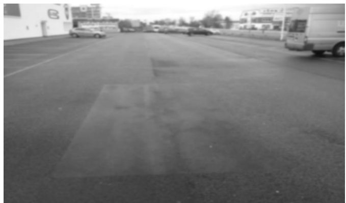
nachher (Ende November 2012)