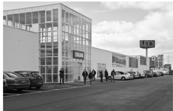
Eingang Modemarkt Ley's