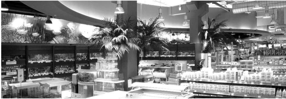
Aquaristik Kölle Zoo