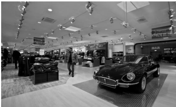
Modemarkt Ley's Zentralbereich

Insbesondere sind für den Erfolg des Konzeptes auch die engagierten Mitarbeiter verantwortlich, so dass Ley's über eine hohe Weiterempfehlungsrate verfügt.