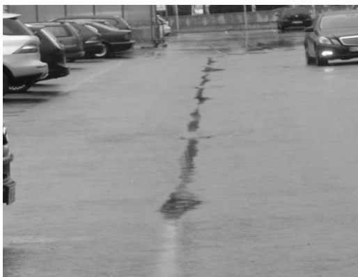
vorher (September 2012)

Hierbei wurden - abgesehen von Mängeln an der Parkplatzasphaltierung - keine nennenswerten Mängel festgestellt. Die Mängel an der Parkplatzoberfläche wurden von der Erstellerfirma aufgenommen und ordnungsgemäß bis zum 22.11.2012 beseitigt, so dass sich die Außenanlagen seitdem wieder in einem neuwertigen Zustand befinden.