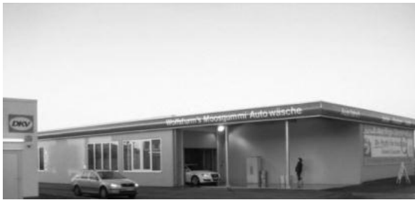
Waschstraße Euro Wash

Eurowasch ist mit der Entwicklung seines Umsatzes ebenfalls zufrieden. Die Mieten wurden im Betrachtungszeitraum immer pünktlich bezahlt.