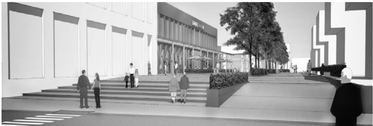
Visualisierung des neuen Vorplatzes aus Blickrichtung von der Wilhelmstraße

Die seit Räumung durch den Gerichtsvollzieher am 02.12.2014 leerstehende Kleinfläche mit rund 31 m 2 konnte Anfang Februar 2016 an ein lokales Reisebüro vermietet werden. In der Fläche soll ein hochmodernes und wegweisendes Reisebürokonzept für Kleinflächen mit hoher Kundenfrequenz entstehen, in dem die Kunden ihre Reisen überwiegend selbst planen können. Nach aktuellem Stand soll die Eröffnung Mitte Juni 2016 erfolgen.