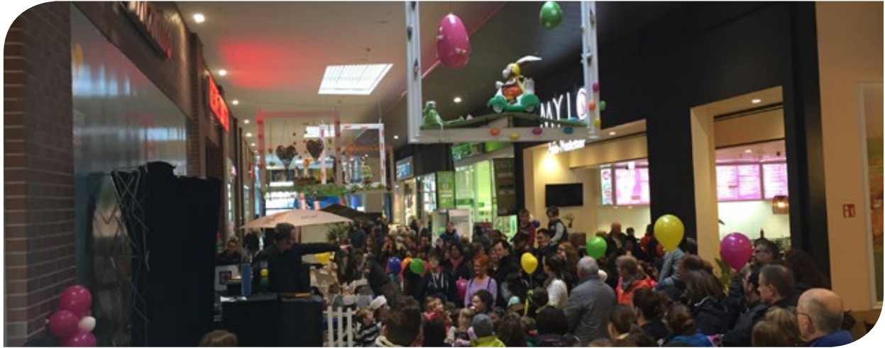
Verkaufsoffener Sonntag "Frühlingserwachen" am 19.03.2016