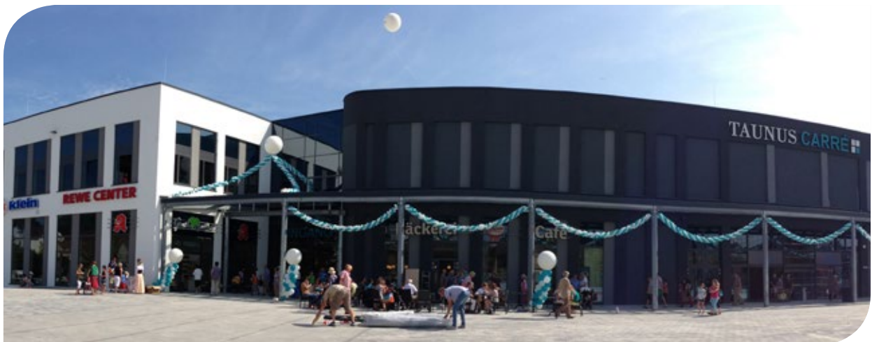
Gebäudeensemble mit Ärztehaus