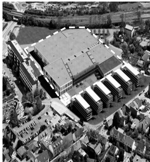
Taunus Carré, Friedrichsdorf