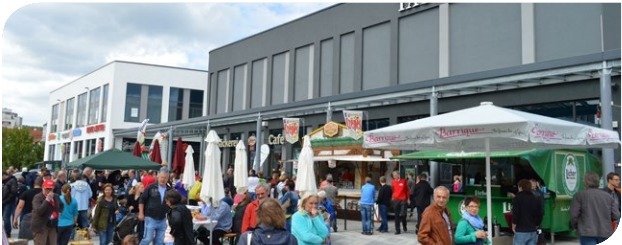
Veranstaltung "Künstler & Karossen" mit verkaufsoffenem Sonntag auf dem Philipp-Reis-Platz und im Taunus Carré am 20. und 21.06.2015