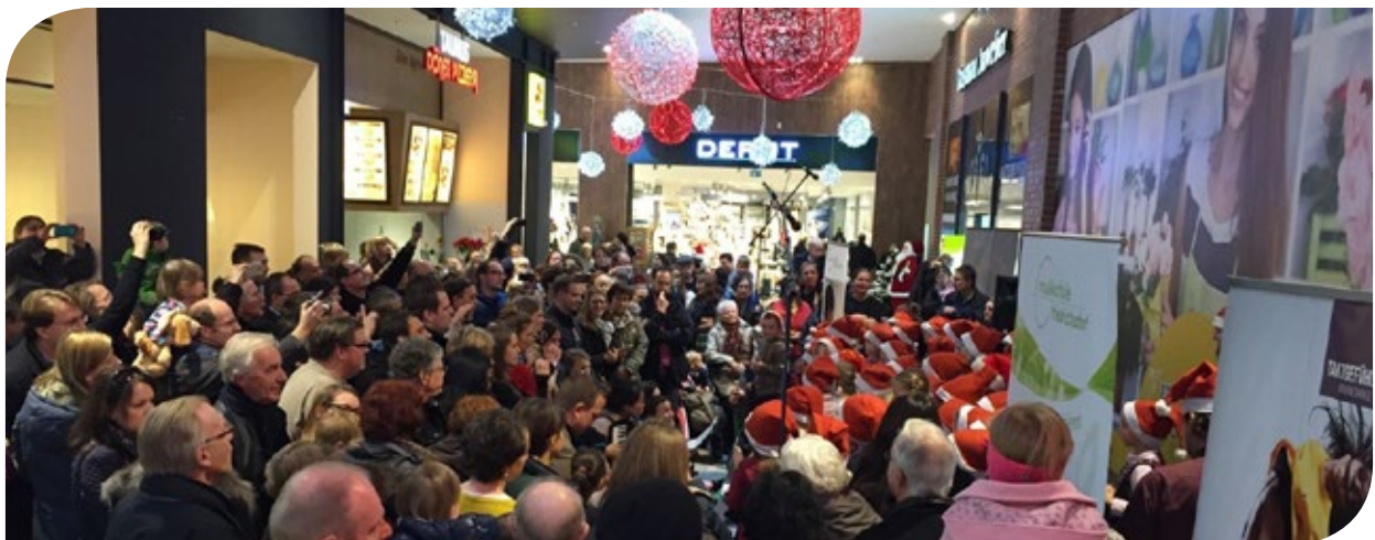
Weihnachten 2015 mit vielen Veranstaltungen wie beispielsweise Weihnachtsmarkt, Eisstockschießen, Nikolausbesuch oder Pianistenauftritt in der Mall