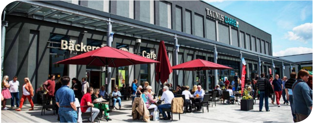
Einkaufszentrum Taunus Carré mit dem zur Fondsimmoblie gehörenden Vorplatz, seit Juni 2015 lautend auf Philipp-Reis-Platz