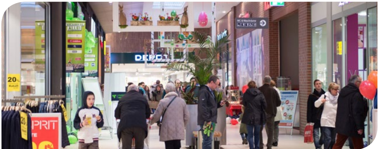
Innenansicht in die Mall